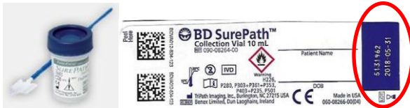
Flacon BD SurePath et CervexBrush

1 - UTILISEZ EXCLUSIVEMENT LES FLACONS PRECONISES PAR BIOPATH-OI (flacon BD Surepath) et le Cervex Brush en vérifiant la date de péremption.